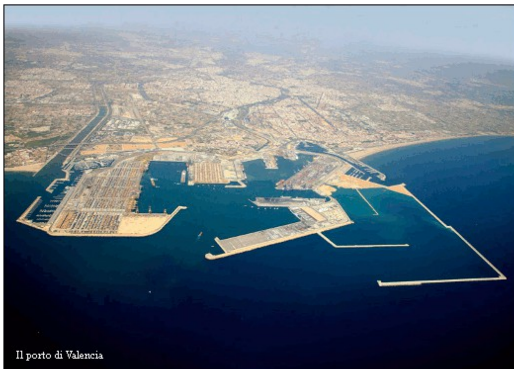
Il porto di Valencia

Nei primi quattro anni di gestione il consorzio prevede di investire 390 milioni di euro nei 14 aeroporti per l'effettuazione di lavori di ammodernamento e ampliamento, mentre per l'intero arco della durata delle concessioni sono previsti investimenti pari a 1,4 miliardi di euro.